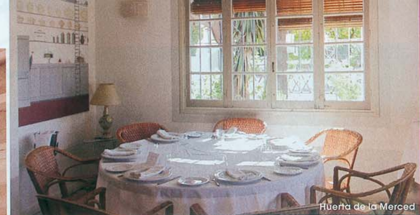
Huerta de la Merced